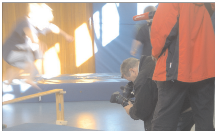
Unter Beobachtung: Buten & Binnen drehte in der Gymnastikhalle.